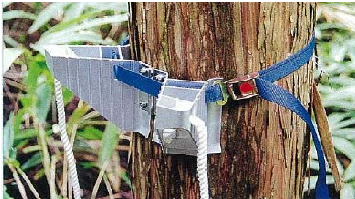
スーパーステップの形状